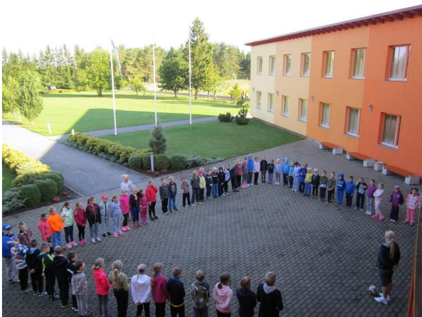
Joonis 1. Näide korrektselt lisatud joonisest.